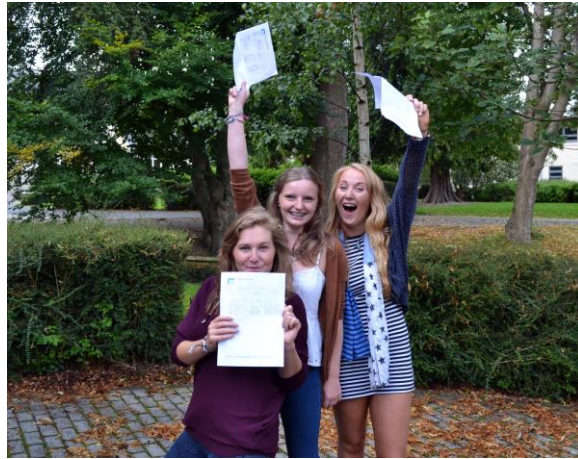
Dathlu Canlyniadau Lefel A